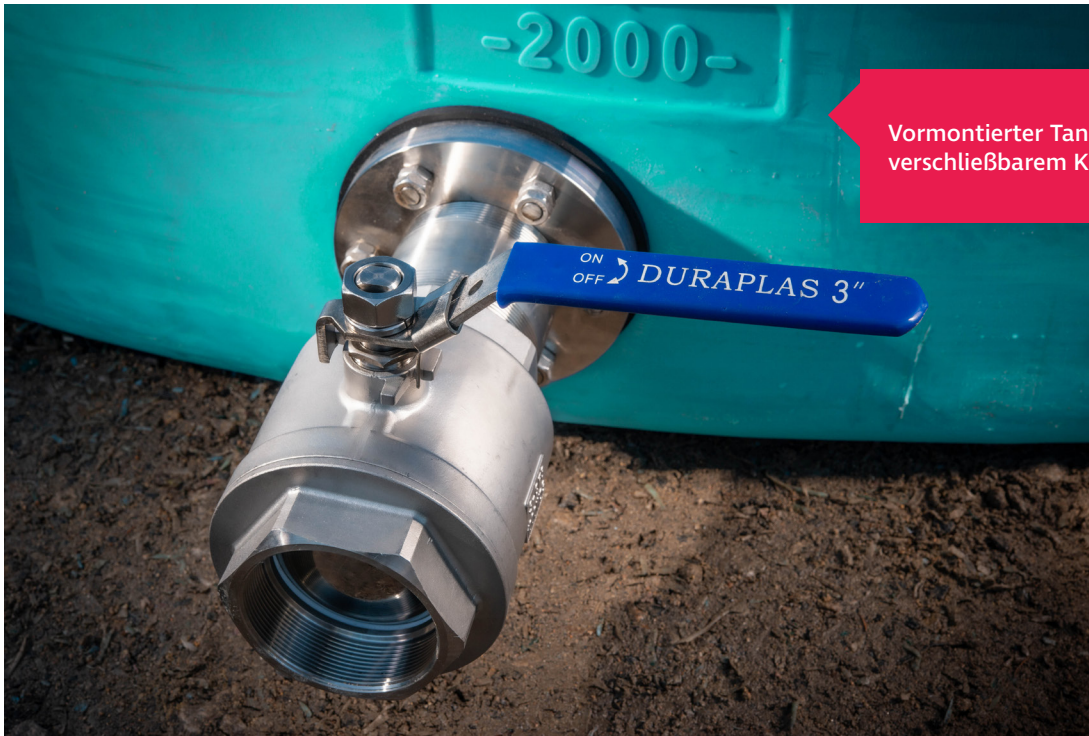
Vormontierter Tankflansch inklusive verschließbarem Kugelhahn DN80